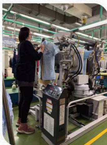
▲半自動機具改成：人形整燙機