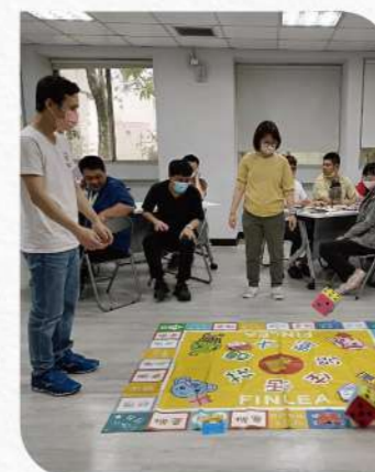
▲在職課程改成：理財管理課程

在財務管理方面，由於部分員工的財務知識較為薄弱，我們設計了簡單的大富翁遊戲，幫助他們理解金錢的價值，學習合理消費和記帳，增強儲蓄習慣。考慮到一些員工在物品整理和居家環境方面的困難，我們還提供親職教育課程，邀請專家教授物品整理、收納技巧及空間美化，幫助他們創造整齊且舒適的生活環境。