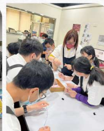
▲在職課程改成：DIY串珠課程