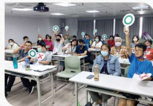
▲ 檢視資訊後，品管員們利用舉牌，直覺表達是否清楚易讀。

課程中，品管員由智能障礙者擔任，和支持者組成小組，分享他們的閱讀體驗，透過他們的生活經驗審查內容和排版，並提供改進建議，例如需要圖片說明時，以照片代替插圖會更直觀；用更簡單直白的敘述取代複雜詞彙等，讓資訊更加易讀易懂。支持者除了協助品管員理解並吸收課程內容，也必須思考如何權衡「引導」和「干預」的界線，讓品管員說出自己的真實想法。