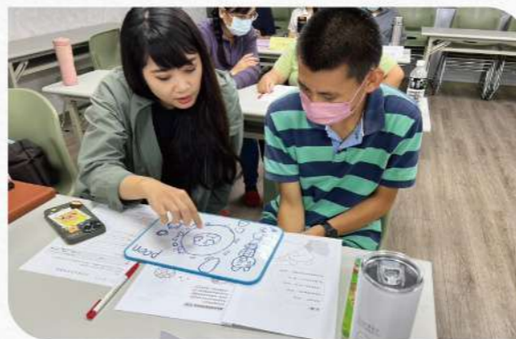
▲ 支持者協助品管員說出對圖畫的真實理解，讓一般人也能認識障礙者讀到的內容。

活動結束時，最鼓舞老師跟社工們的是，當求知不再是障礙，心智障礙者也能大聲說出深藏在心中的「讀立」願望——「老師，下一次我要讀介紹國外的易讀本，我想坐飛機出國玩！」