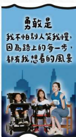
勇敢金句·宜嫻、宗侑