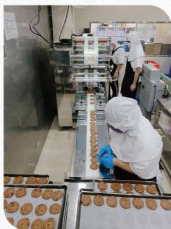
▲半自動機具改成：自動包裝機

此外，工場會根據員工的不同障礙需求，進行「職務再設計」。就業服務員會設計一些輔助工具，例如蛋捲計數架和摺衣板，幫助員工更準確地完成工作，減少錯誤和客訴的機會。這些措施不僅幫助身心障礙者克服工作中的挑戰，還提高了他們的職業技能和自信心。