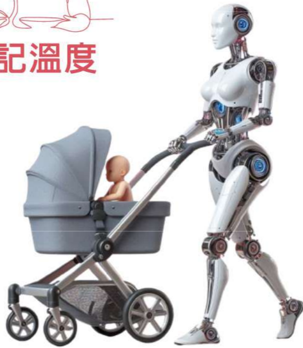
▲在科技便利的今日，各類 3C 產品儼然成為最好取得的「電子保母」。

清晨的餐桌上，孩子看著平板吃早餐；午後，手機成了安撫情緒的工具；夜晚，線上學習取代了部分陪伴。科技讓照顧變得更便利，也讓大人得以喘息，卻也在不知不覺中拉開了親子之間的距離。當科技成為孩子成長中的日常，或許我們更需要思考：在這樣的時代裡，真正重要的事情，究竟是什麼？