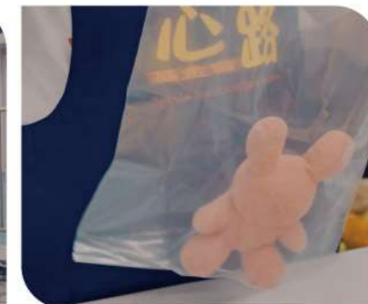
▲心路創造機會，讓庇護員工在工作中也能參與減碳行動。

這天，是個特別的日子。慈佑庇護工場的員工暫時放下手邊工作，齊聚會議室觀賞《陪玩偶找新家》的影片，當熟悉的身影出現在螢幕上，大家不禁相視而笑。影片播畢，工場主任拿起麥克風說：「你們做了這麼棒的事，我們一定要讓你們知道。」話音剛落，現場隨即響起歡呼。歷經一個月密集清洗娃娃的辛勞，也在此刻有了答案。