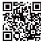
閱讀雙月刊網頁版