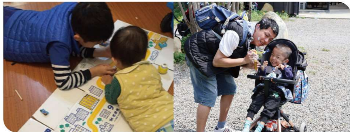
▲學齡前的孩子會需要透過大量的模仿父母、老師、同儕來習得新技能。

近年來，3C產品與網路科技快速普及，智慧型手機、平板與各式影音平台已走入多數家庭的日常。對忙碌的家長而言，科技不僅是資訊來源，也常成為育兒的輔助工具：孩子哭鬧時播放卡通、用平板轉移注意力，或透過網路與AI尋找教養建議。科技確實帶來便利與即時性，但當螢幕逐漸取代面對面的互動，孩子長時間處於被動觀看的狀態，也可能對其發展與人際連結帶來影響。