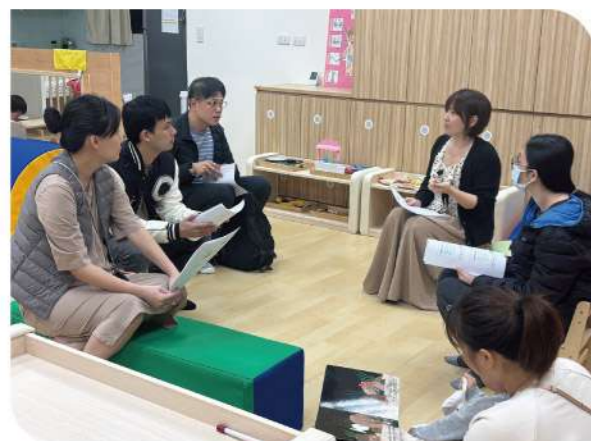
▲辦理招生說明會，協助家長了解心路的照顧理念。

目前「樟新社區公共托育家園」提供12名幼兒的照顧服務，心路也持續為托育人員安排專業培訓，將早療觀念融入日常照顧之中，提升整體服務品質。從專業出發，走入社區，心路期待「樟新社區公共托育家園」不只是托育的場所，更是一個串聯家庭、專業與社區的支持網絡。