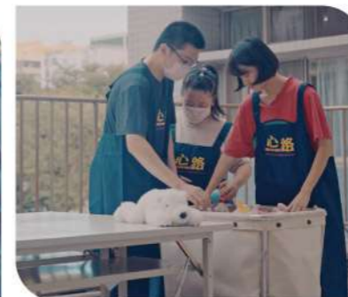
▲為了降低碳排，省去烘乾程序，改採晾曬。