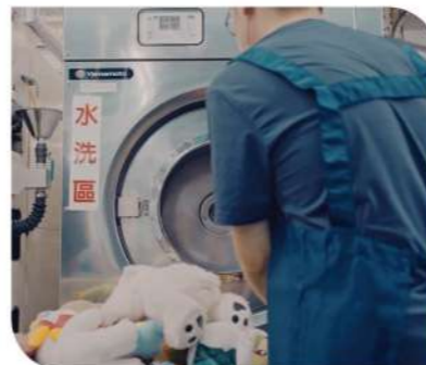
▲庇護員工貢獻洗衣專長為淨零出力。