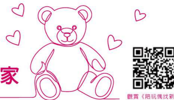
觀賞《陪玩偶找新家》