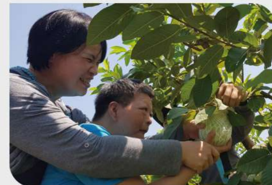
▲藉由農作與勞動，惠如陪伴服務使用者從中培養生活能力。