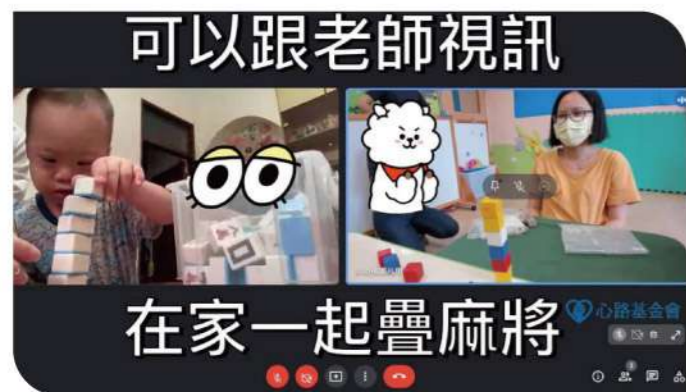
▲心路早療服務結合科技，讓專業支持更貼近家庭與孩子的需求。

因此，在科技快速發展的時代，我們或許不需要完全排斥3C產品，而是更需要重新思考：科技應該如何被使用，才能真正支持孩子的發展。對孩子而言，最重要的仍然是與照顧者之間的互動、陪伴與關係。一同說話、一起笑、一起玩或一起解決問題，這些看似平凡的日常互動，正是孩子發展語言、情緒與社會能力最重要的養分。