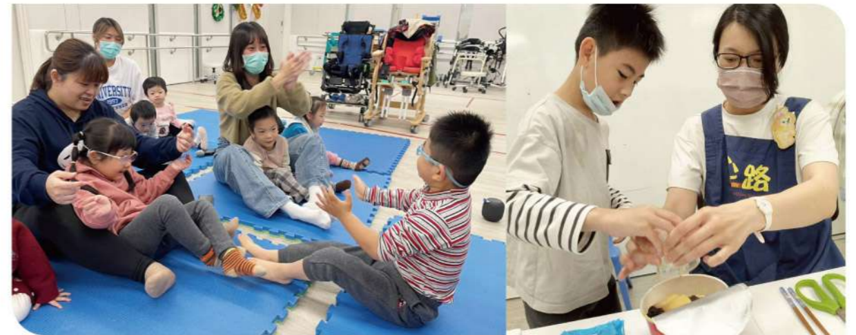
▲藉由遊戲時光，心路老師陪伴孩子發展專注力與互動能力。

這也凸顯了早期療育服務在現今社會中的重要性，早期療育服務不只是提供孩子療育訓練，更重要的是陪伴家長理解孩子的發展需求，並在眾多資訊中協助家長做出合適的判斷。透過專業評估，早療老師與社工可以與家長一起討論孩子目前的能力與需要，找出適合家庭情境的教養方式。