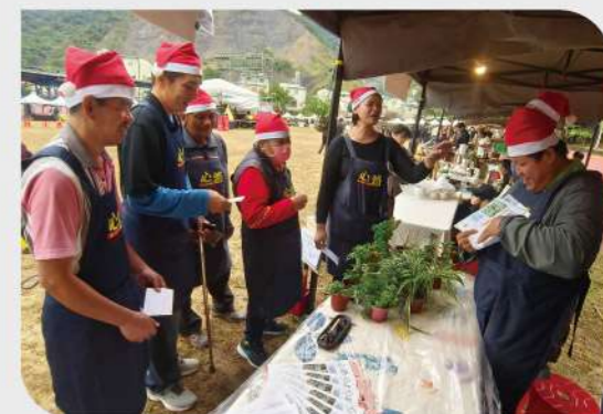
▲惠如帶領服務使用者參與擺攤，練習與人互動，拓展生活經驗。