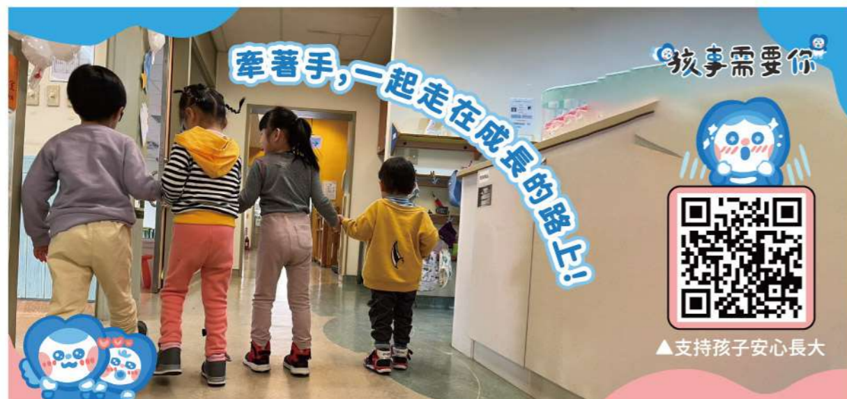
▲支持孩子安心長大

在科技便利的世界裡，孩子最需要的，依然是那個願意蹲下來看著他、與他說話、陪他一起探索世界的大人。而這份來自「人與人之間」的連結，正是任何科技都無法取代、也最值得我們珍惜與守護的力量。