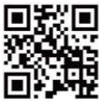
取消紙本訂閱 填寫表單

若您不需要收到紙本雙月刊，或欲改訂心路電子報，請掃描右側QRcode填寫表單，或來電告知您的訂閱者姓名、地址、客編（封面寄件名條左下角英文+數字），以便後續處理，謝謝！